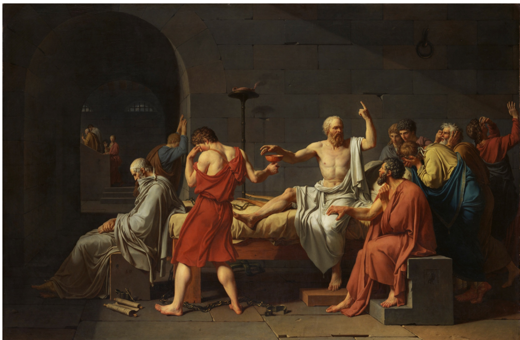
By Jacques-Louis David - https://www.metmuseum.org/collection/the-collection-online/search/436105 , Public Domain, https://commons.wikimedia.org/w/index.php?curid=28552

Deute die Situation. Was denken die Menschen auf dem Bild? Beschreibe.